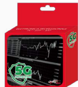
Imballo 13 x 14 x 5 cm